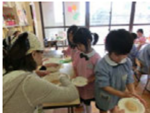
きなこをまぶせばきな粉もちの出来上がり!!