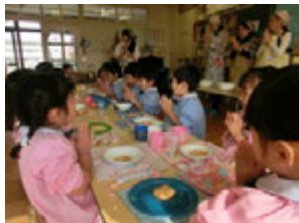
お手伝いしてもらったお母様方といっしょに