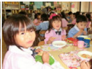
おもちを口に入れたみんなの顔からはほっぺが落ちそうなくらいの笑顔が満ち溢れていました(#^.^#)