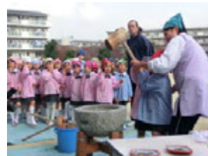
先生に少し力をかりてとても美味しそうなおもちの出来上がり!!