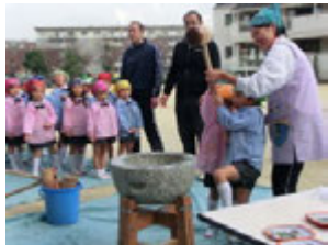
つぎはぼく達、わたし達の番だね(^.^)v