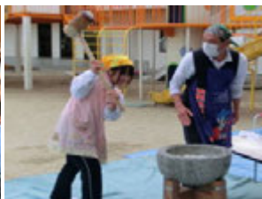
みんなの大きな声援が幼稚園じゅうに響きわたっていました(^.^)