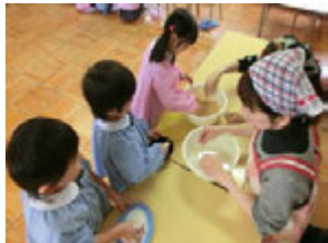
出来たてあつあつのおもちに少しお水をつけて