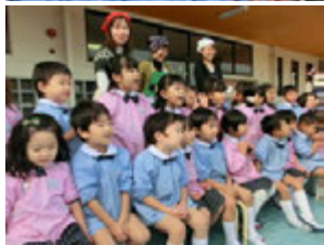
身体まで動いての声援に先生達は大張りきりでした(^.^)v