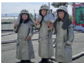
放水体験では防火服を着てすごい水圧のホースから出てくる水を的に目掛けて発射!!