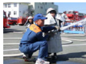
消防士さんがしっかり手伝ってくれているからばっちりに命中!