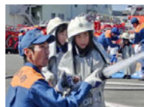
消防士さんってこの服を着ていつも訓練や消火活動をしているからすごいよね!!