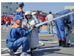
でもこの防火服ってとっても重いんだよね(@_@)