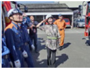
園長先生と藤谷先生が40mもはしごを伸ばしたはしご車に体験乗車!!