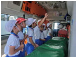
救急車に乗せていただき、たくさん付いている計器や道具の役割も教えてもらっちゃった(^^)v