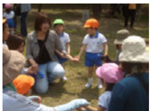
仲間集めゲームでは色々なクラスのお友達と手をつなぎ、お友達になれたかな?!