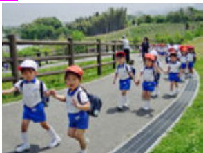
年中組さんがとんぼ池公園へ遠足に出かけてきました!!