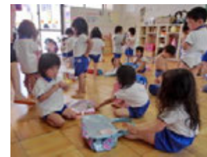
シャツやパンツ、体操服などお友達のもの間違えないように気を