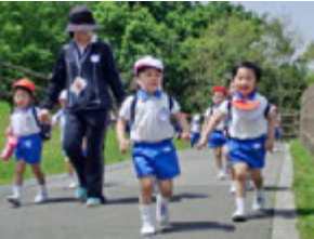
すこし暑かったけど