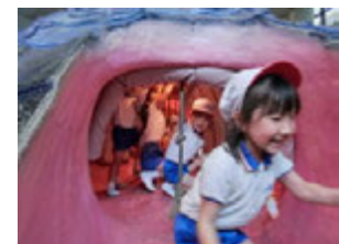
口から入ったので出てくる所はもちろんワニのおしりからとっても元気よく出てきたよ(^)