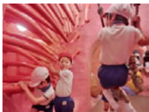
でもそんなことにおかまなしに元気よく、ヒダヒダにぶらさがったり、のどんこをゆらしてワニを困らせていました(^)v