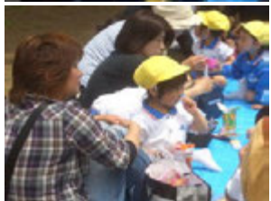
おやつタイムはもうさくらは散っちゃったけどみんなの笑顔が満開で公園じゅうが素敵なお花畑のようになっていました (*^_^*)