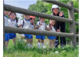
たんぼぼを見つける事が出来る余裕まであってやさしさと元気よさ、そして心強さを兼ね備えた年中組さんでした。