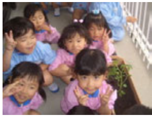
出来上がったトマトはどうするのかも考えておかなかっちゃ(^)v