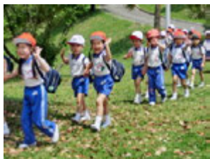
丘を越え、野原を歩いて行くと？