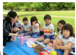
ふたを開けるとみんな、大好きなお母さんが作ってくれたお弁当のお披露目でお弁当自慢をしていました(^)v