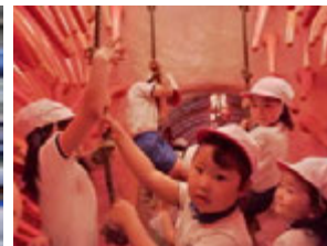
大きなどんこやお腹のヒダヒダが両側にあって少し気味悪かったね(@_@)