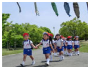
みんなを出迎えてくれたのは今回も大きなこいのぼりでした \ (^o^)/