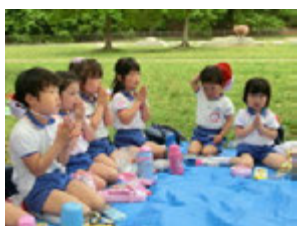
たくさん遊んだ後には 楽しみにしていたことの2つ目のランチタイム (*^_^*)