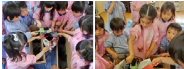
みんなで力を合わせてプランターに土を入れて!!