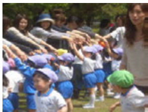
たくさんの人で出来たトンネルをうまく通ることが出来るかな？