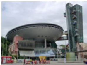
年長組さんが大阪府立大型児童館ビッグパンへ遠足に行ってきました(^)♪