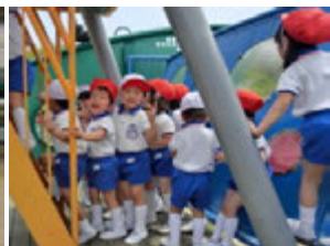
すべり台をすべってくると