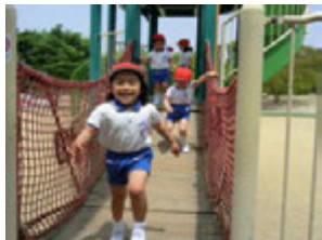
リュックを置くときすぐさま、大きなトンボの遊具に出発!! つり橋に円形のトンネルの中も元気よく、走る走る!! 年中組さんになると運動量がさすがに違ってくるね(^)v